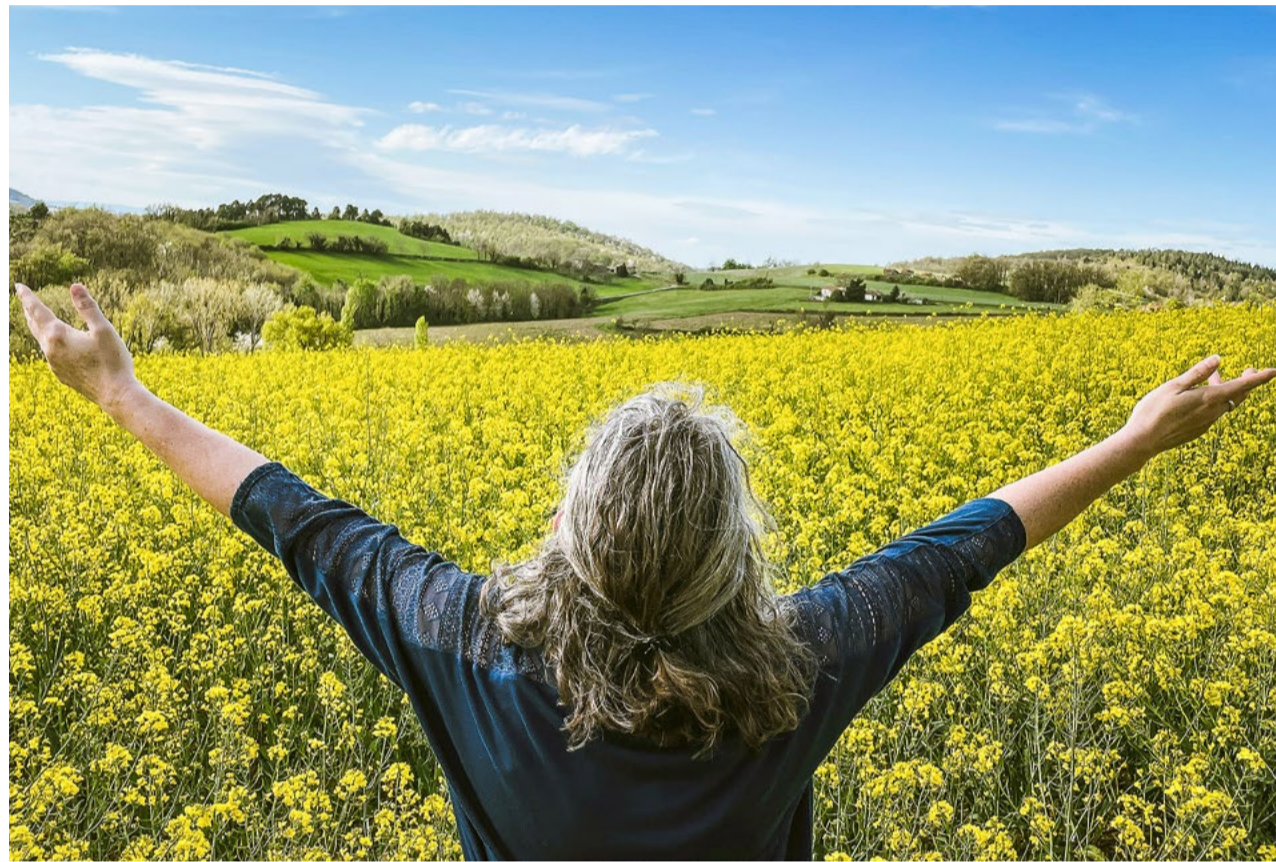
Getragen, bis ich grau bin.

Die Lebensmitte ist kein Punkt, an dem etwas endet, sondern ein Übergang. Sie ist kräftig wie der Sommer, voller Energie und doch auch begleitet von der Ahnung, dass andere Jahreszeiten folgen können.