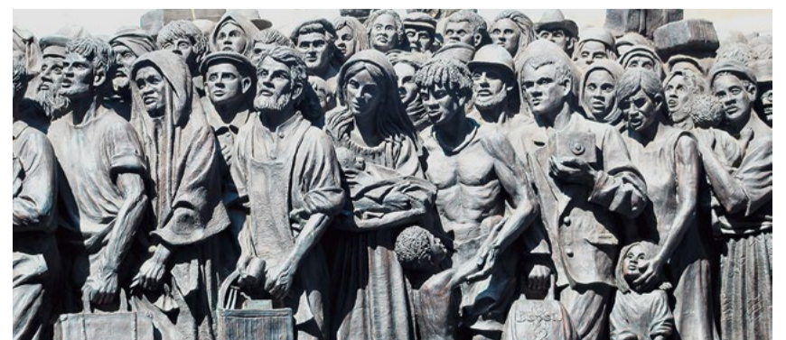
«Angels unaware» Monument, Petersplatz Vatikanstadt.

Und unterdrückt nicht die Witwe und die Waise, den Fremden und den Armen. Und keiner ersinne in seinem Herzen Unheil gegen seinen Bruder. Sacharja 7,10