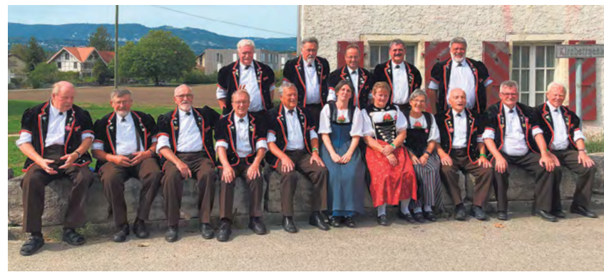
Jodlerklub Blüemlisalp Brügg.