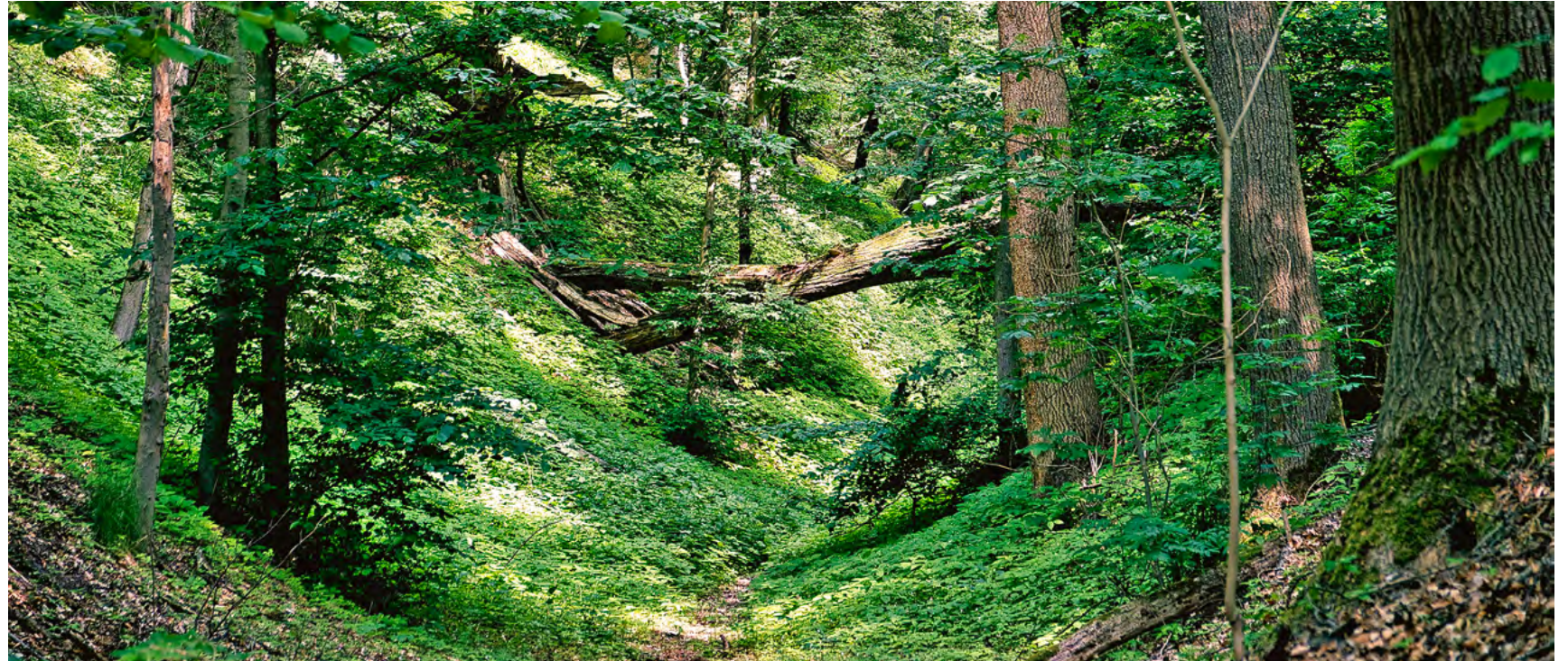
Raus in die Natur.

An Ostern feiern wir die Auferstehung von Jesus Christus und damit die Überwindung vom Tod. Dies ist ein Ereignis, dass so ja eigentlich gar nicht sein kann: Für uns Menschen ist der Tod die absolute Zäsur, die letzte Grenze – auch noch in der heutigen Zeit, in der uns sonst fast alles möglich scheint. Jesus hat diese Grenze aufgehoben. Wenn wir als Christen dieses unglaubliche Ereignis glauben lernen und für uns in Anspruch nehmen, eröffnen sich uns auch neue Räume und Perspektiven. Die Frage drängt sich auf, was auch sonst noch möglich sein könnte und welche weiteren