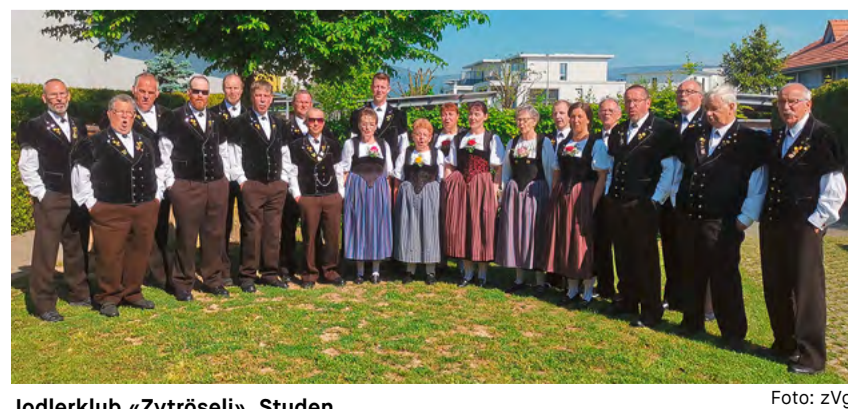
Jodlerklub «Zytröseli», Studen

Alle sind im Namen des veranstaltenden Vereins, des Jodlerklubs «Zytröseli», und der Kirchgemeinde Bürglen herzlich eingeladen.