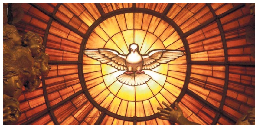
Gian Lorenzo Bernini, ca. 1660